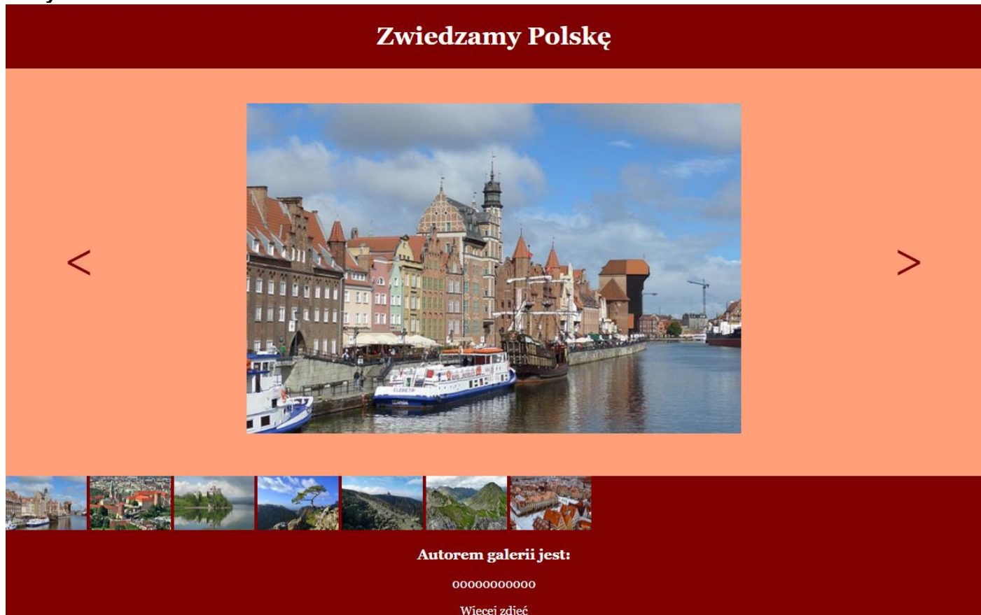
Obraz 2. Witryna internetowa.