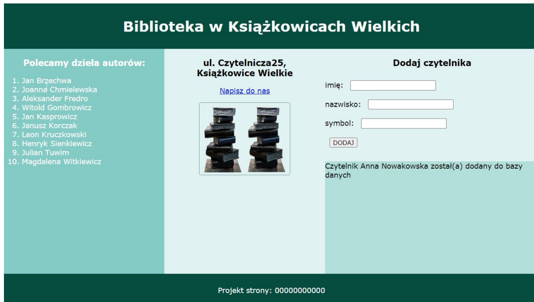
Obraz 2. Witryna internetowa. Po zatwierdzeniu danych z formularza