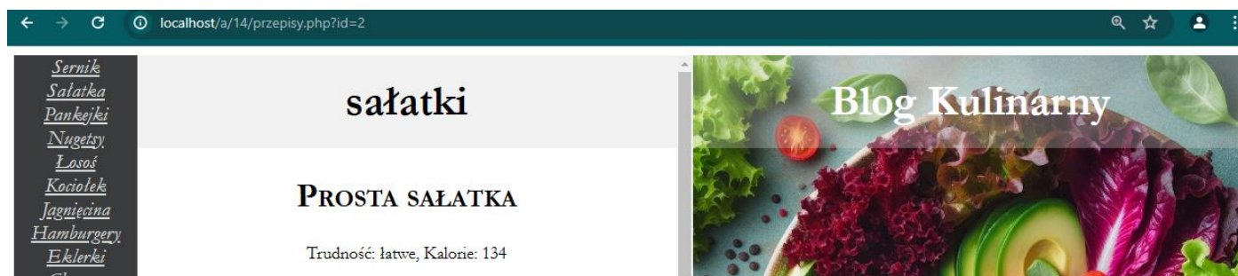
Ilustracja 5. Fragment strony z adresem wykorzystującym żądanie GET