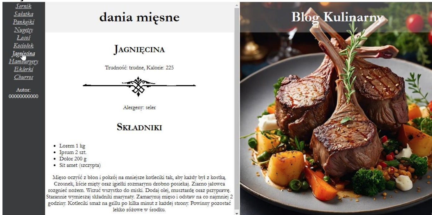
Ilustracja 2. Wygląd witryny internetowej, kursor na odnośniku „Jagnięcina”