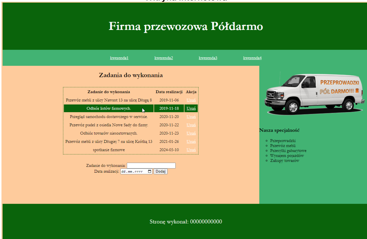
Ilustracja 2. Wygląd witryny internetowej. Kursor myszy na trzecim wierszu tabeli