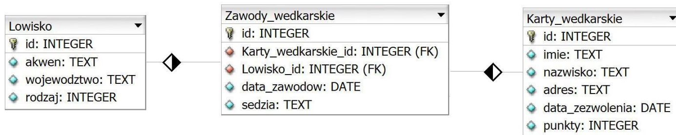
Obraz 1. Baza danych

Fragment bazy danych jest zgodny ze strukturą przedstawioną na obrazie 1. Tabela Zawody_wedkarskie jest połączona relacją z tabelą Lowisko (opisuje łowisko, gdzie będą się odbywać zawody) oraz tabelą Karty_wedkarskie (opisuje wędkarza, który wygrał zawody). Tabela Lowisko zawiera pole rodzaj, którego wartości oznaczają: 1 – morze, 2 – jezioro, 3 – rzeka, 4 – zalew, 5 – staw